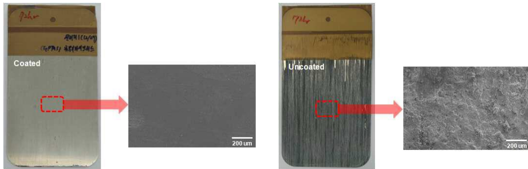
[휴대폰 케이스의 부식실험 결과 사진]