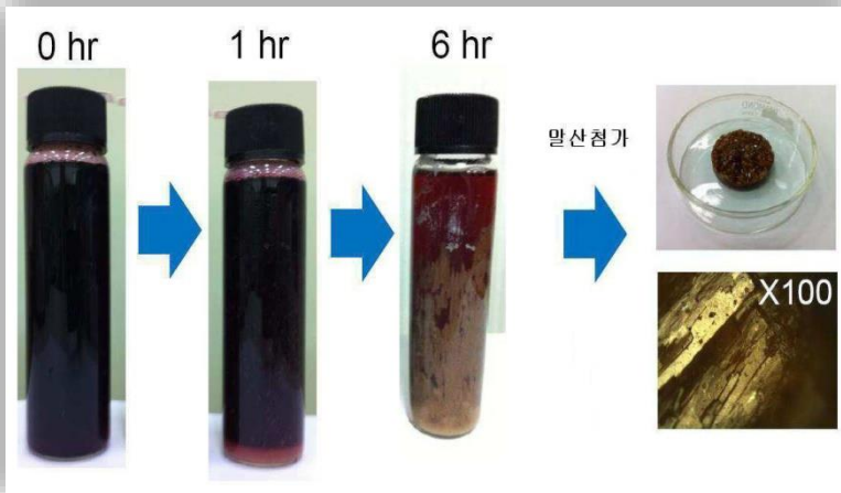
[밀산을 추가로 첨가하여 석출된 석출물]