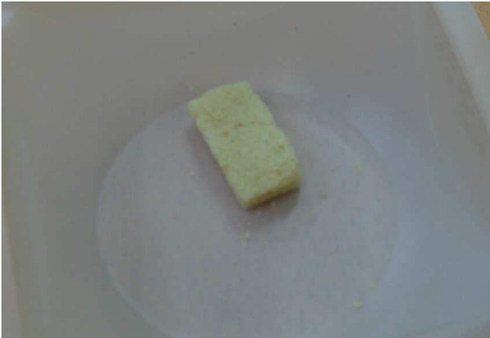
[본 기술에 따라 제조된 생체조직공학용 베타-글루칸 기반 지지체]