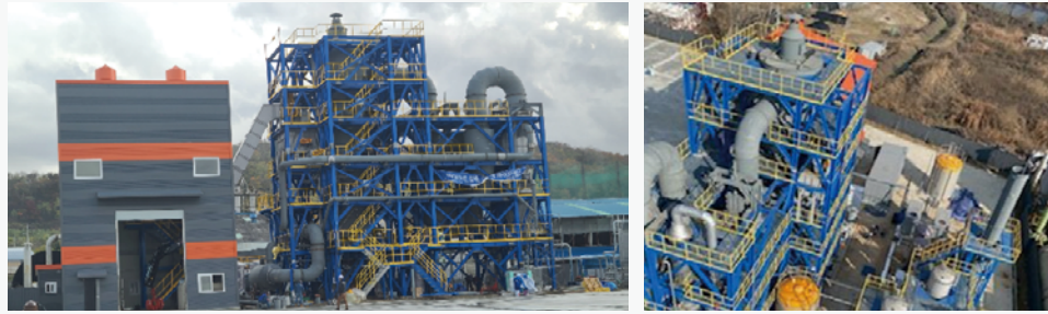
〈50 ton/day급 바이오매스 가스화 시스템 전경〉