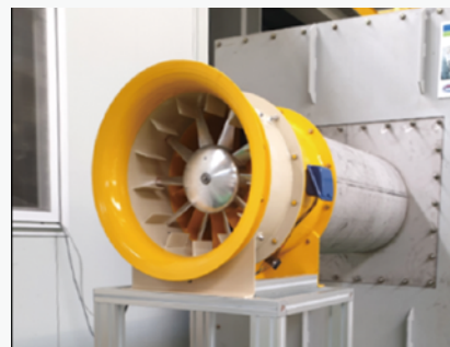
〈한국생산기술연구원 천안본원 실험1동〉

10 : 축류 송풍기, 20 : 케이싱, 22 : 내주면, 30 : 허브, 40 : 안내깃, 50 : 날개, 60 : 실속 방지 구조(핀), \delta : 핀과 날개 사이 간격, l_a : 핀의 축방향 길이, l_r : 핀의 반경방향 길이