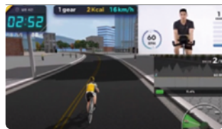
기존의 기술 가상공간데이터 ↔ 사용자(캐릭터) 연동