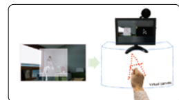
원격 비접촉 제어 입력 방식

본 기술은 사용자 정면에서 획득된 3차원 point cloud 정보로부터 가상의 캔버스 공간에 손으로 제어 명령을 줄 수 있음에 따라 가상체험 화면을 지속적 응시하여 몰입감이 극대화 됨.