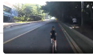
제안된 기술 실제공간데이터 ↔ 사용자(캐릭터) 연동