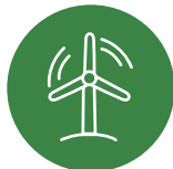
풍력, 소수력, 지열